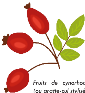
Fruits de cynorhodon (ou gratte-cul stylisé...)